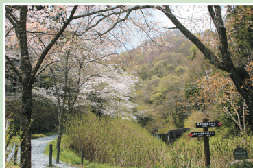
眺望・樹海コース登山口