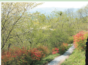
頂上付近のヤマツツジ